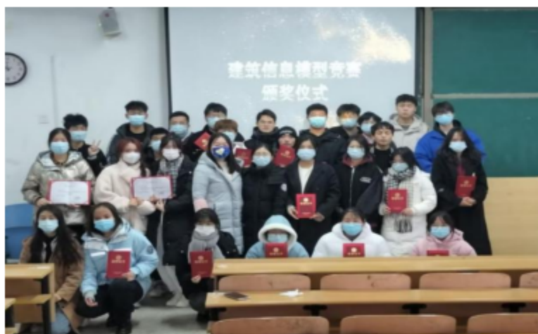
图4 国土杯“BIM应用”技能大赛