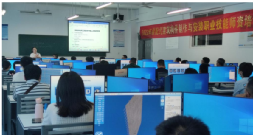
全国装配式构件制作与安装职业技能师资培训

校企合作共赢，校内发展助推企业发展需求。3年来，校企合作在职工培训，继续教育方面取得一定成绩，完成全国装配式构件制作与安装职业技能师资培训 50 人，完成建筑信息模型（BIM）“1+X”证书骨干师资 10 人。