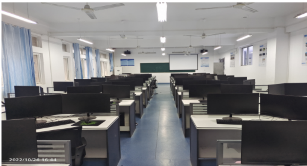
图 2 校内实训室建设

每年通过教师顶岗锻炼、对外技术服务、企业集中培训等方式，落实校企师资队伍共同建设工作，培训建筑信息模型（BIM）“1+X”证书骨干师资 10 名，3 名专业教师以高分通过建筑信息模型（BIM）“1+X”中级证书考试，4 名教师获得“1+X”建筑信息模型（BIM）高级证书，打造了能够满足校内外教学与培训需求的教学创新团队。