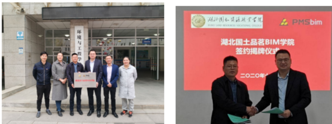
图 1 湖北国土品茗 BIM 学院签约揭牌仪式

湖北国土资源职业学院与品茗科技股份有限公司根据《国家职业教育改革实施方案》、《教育部关于开展现代学徒制试点工作的意见》、《教育部职成教司关于开展现代学徒制试点工作的通知》等文件精神，为进一步加强学校和企业之间的合作与交流、充分发挥校企双方的优势，发挥职业技术教育为社会、行业、企业服务的功能，为企业培养更多的高素质、高技能应用型人才，同时，充分发挥企业的技术优势、设备设施优势、信息优势，为学校开展专业、课程、师资队伍、对外技术服务、学生实习、实训、就业提供更大空间，2020年，在彼此了解、充分沟通的基础上，品茗科技股份有限公司与湖北国土资源职业学院签订战略合作协议，共同建设“品茗BIM学院”。